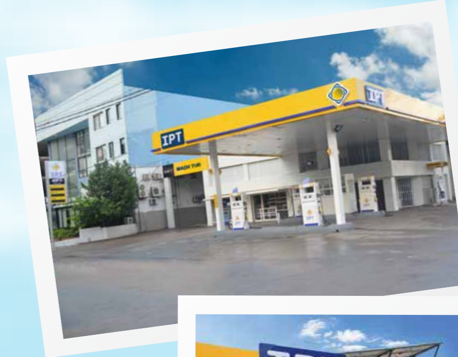
محطة كسليك، الكسليك

تعرف الآن على المحطات التي انضمت مؤخراً إلى شبكة محطات أي بي تي.