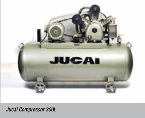
Jucai Compressor 300L