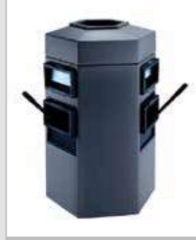
DCI 755104 (Blue), 755101 (Black)